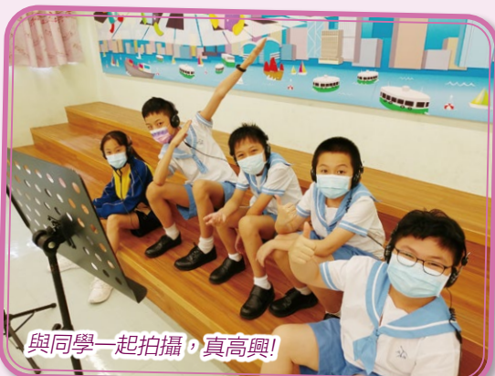
與同學一起拍攝，真高興！