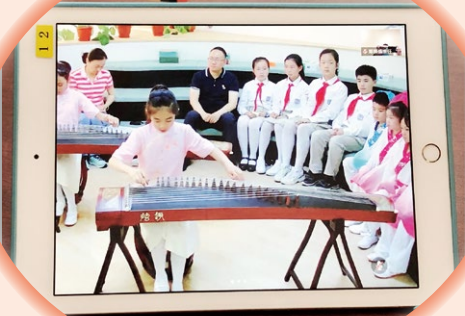
上海銅川學校古箏演奏