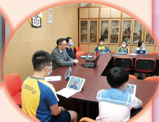
慈雲山聖文德天主教小學視像交流