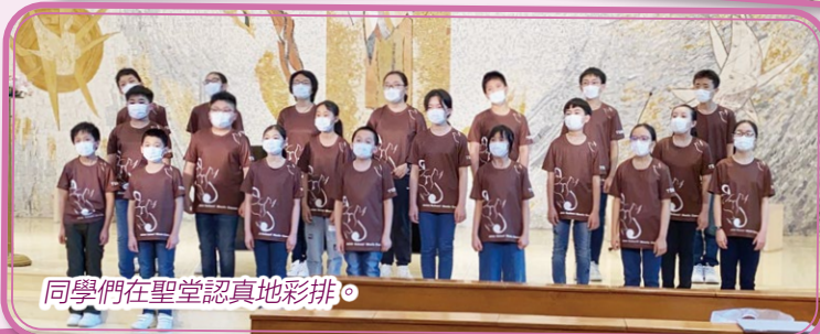
同學們在聖堂認真地彩排。