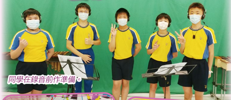
同學在錄音前作準備。