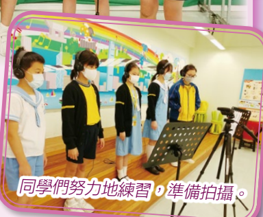
同學們努力地練習，準備拍攝。