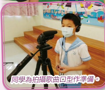
同學為拍攝歌曲口型作準備。