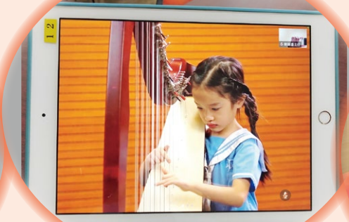
聖文德天主教小學豎琴演奏